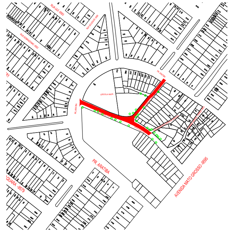
01 | PLANTA DE SITUAÇÃO ESCALA 1:5000