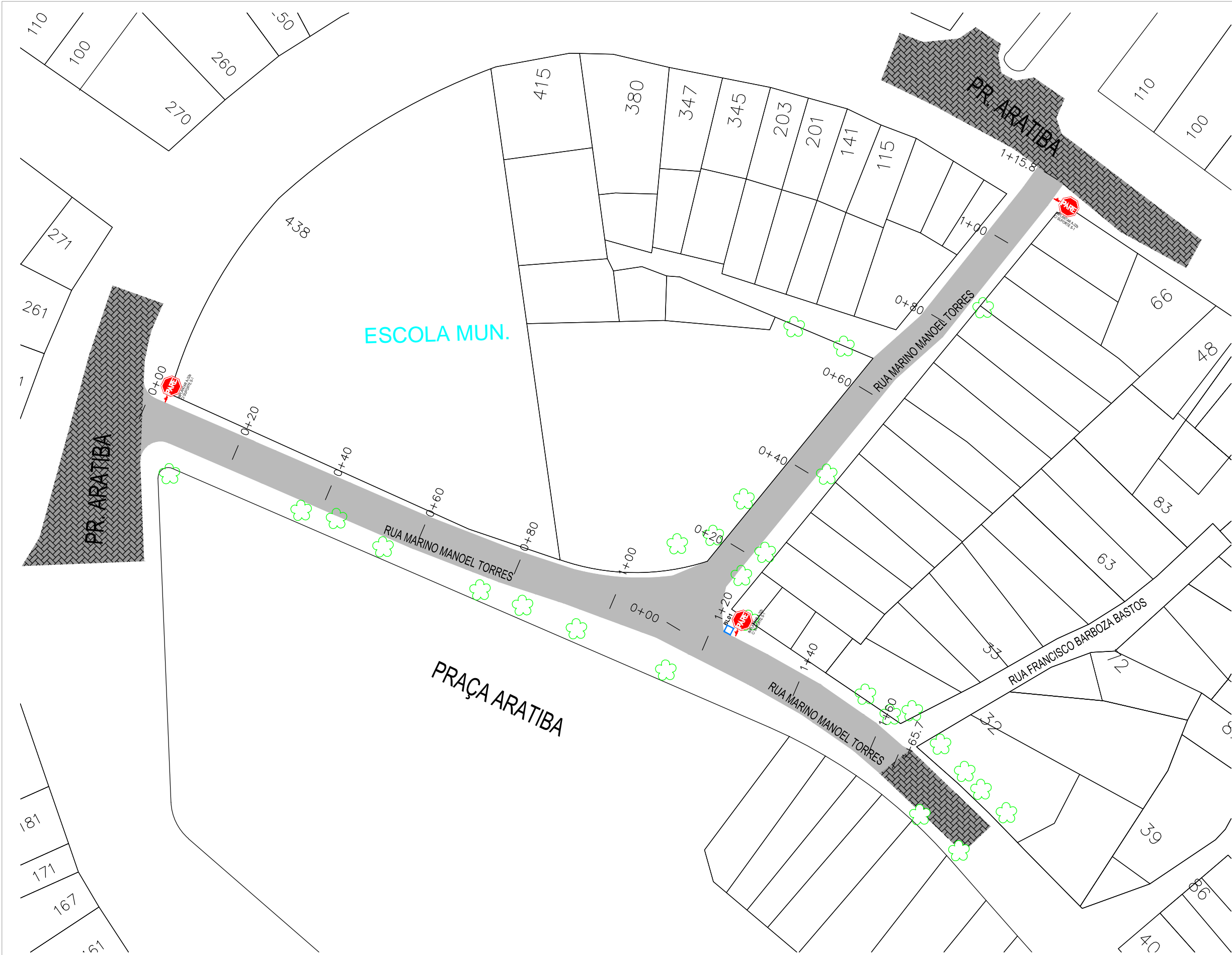
02 | PLANTA BAIXA ESCALA 1:150