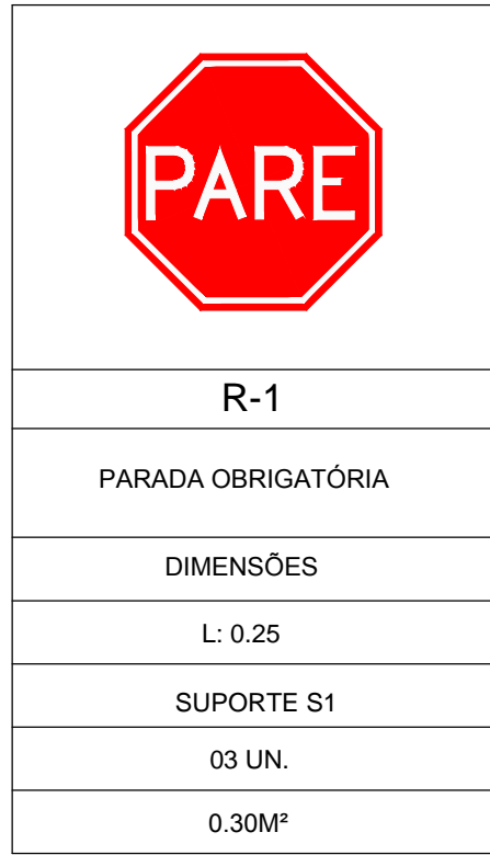
05 | SINALIZAÇÃO SINALIZAÇÃO VERTICAL